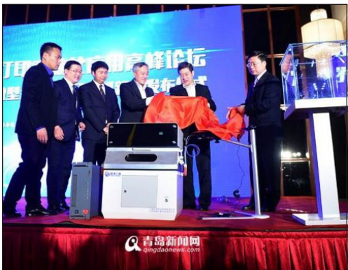
Esta mini impresora 3D fue diseñada para fabricar joyas de oro y plata.

El gobierno chino apoya la tecnología 3D y un informe de International Data Corporation (IDC) lo corrobora: según IDC, en 2014 se enviaron unas 34.000 unidades a China y ese número se ha duplicado hasta las 77.000 unidades en 2015. La consultoría estima que en 2016 se venderán 160.000 impresoras 3D en China.