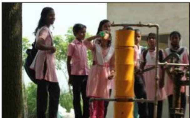
Una unidad de purificación de agua potable con nanoplatina se instaló en una escuela en una región de la India afectada por el arsénico, ofreciendo agua sin arsénico a 300 estudiantes. Se han instalado cientos de instalaciones similares, con otros modelos que dan servicio a comunidades más grandes.

Durante la última década, el trabajo del profesor Pradeep se ha acelerado, logrando grandes hitos. En 2007, su equipo desarrolló un sistema de filtración de agua , que fue capaz de eliminar endosulfán, malatión y clorpirifos, tres pesticidas que se encontraron en niveles elevados en los suministros de agua de la India. Por este motivo se han vendido más de 1,5 millones de unidades de nanofiltración de plata en la India y se estima que estos filtros han mejorado la calidad del suministro de agua a más de 7,5 millones de personas. Los trabajos más recientes han visto cómo las tecnologías que contienen plata combinadas con otras innovadoras jaulas de nanoescala ayudan a eliminar el arsénico del agua, un gran avance que ha beneficiado a 400.000 personas en la India. El Ministerio de Agua Potable y Saneamiento ha aprobado estos trabajos para que se apliquen a nivel nacional.