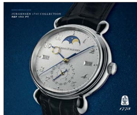
El polvo de plata le da a la esfera del reloj Referencia 1741 Platinum Urban Jürgensen un efecto mate.

Hoy en día, los relojeros de lujo quieren el mismo acabado graneado pero sin el uso de materiales peligrosos. Actualmente, tres modelos nuevos de relojes suizos Urban Jürgensen expuestos en Baselworld 2016, el salón mundial de la relojería y joyería, disponen de una esfera granulada que le da ese deseado efecto mate. Para lograr este aspecto, Urban Jürgensen comienza con un disco de plata fina grabado con números y marcas. A continuación, van añadiendo capas poco a poco con una mezcla patentada de plata, sales y otros ingredientes pulidos a mano en la esfera. A través de un proceso electroquímico, la superficie se vuelve perlada y mate, dándole un color plateado con profundidad y granularidad. El tratamiento se realiza a mano, por lo que no hay dos relojes iguales; la firma dice que esto aporta una mayor exclusividad.