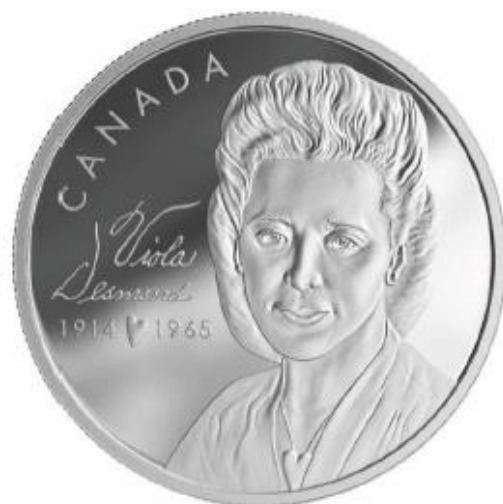
加拿大皇家造币厂以这枚金币向民权先驱 Viola Desmond 致敬。