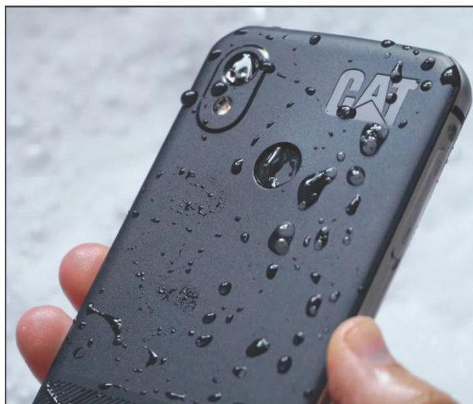
军用级 Cat S42 智能手机防水防震，具有银基抗菌特性。

Biomaster 涂层在很多商业级和消费级产品中均有所采用，其中包括了可重复使用购物袋、办公用纸和包装材料等。