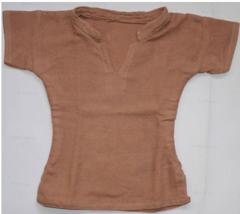
图中半袖衫采用红花生皮提取物染色。

他们的结论是：“从报告给出的数据可以看出，在染色之前使用金属前体（他们也测试了钯）处理过的样品的颜色强度最高、色牢度达到了优良-优异范围、紫外线阻隔率出色 (97.4%)，生物灭杀能力优异（微生物减少率达到了 93.01 到 99.51%）。”